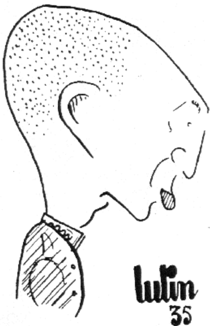
Mistrz M. Najdorf.